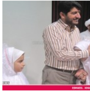
رودان نیوز : 850 دانش آموز دختر رودانی آغاز تکلیف دینی خود را جشن گرفتند