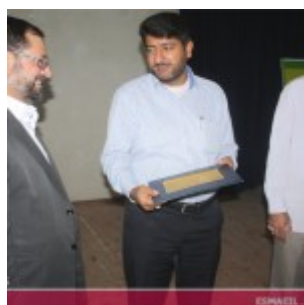
رودان نیوز : همایش فصلی برای زندگی