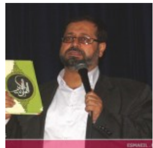
رودان نیوز : همایش فصلی برای نبض زندگی