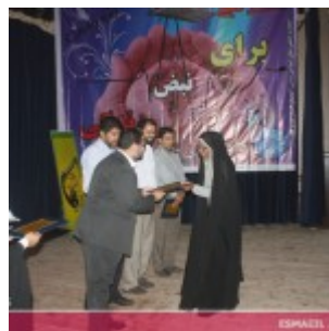
رودان نیوز : همایش فصلی برای نبض زندگی