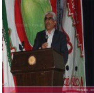
رودان نیوز : همایش فرهنگ سازی سلامت