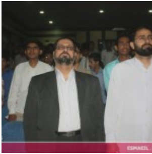
رودان نیوز : همایش فصلی برای نبض زندگی