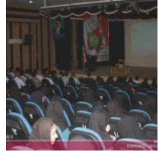
رودان نیوز : همایش فرهنگ سازی سلامت