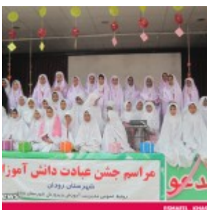
رودان نیوز : 850 دانش آموز دختر رودانی آغاز تکلیف دینی خود را جشن گرفتند