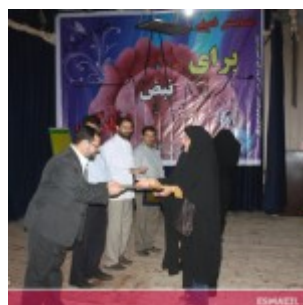
رودان نیوز : همایش فصلی برای زندگی