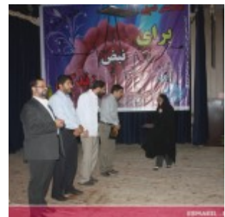
رودان نیوز : همایش فصلی برای نبض زندگی