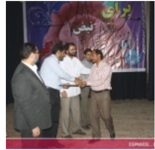
رودان نیوز : همایش فصلی برای زندگی