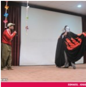
رودان نیوز : 850 دانش آموز دختر رودانی آغاز تکلیف دینی خود را جشن گرفتند