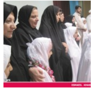
رودان نیوز : 850 دانش آموز دختر رودانی آغاز تکلیف دینی خود را جشن گرفتند