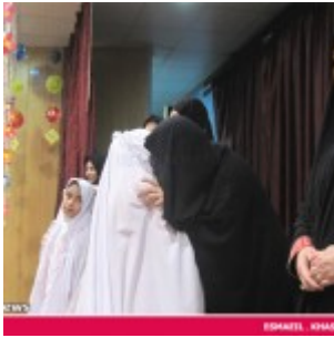
رودان نیوز : 850 دانش آموز دختر رودانی آغاز تکلیف دینی خود را جشن گرفتند