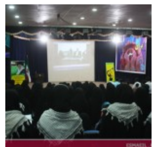
رودان نیوز : همایش فصلی برای نبض زندگی