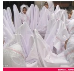
رودان نیوز : 850 دانش آموز دختر رودانی آغاز تکلیف دینی خود را جشن گرفتند