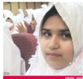
رودان نیوز : 850 دانش آموز دختر رودانی آغاز تکلیف دینی خود را جشن گرفتند