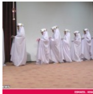
رودان نیوز : 850 دانش آموز دختر رودانی آغاز تکلیف دینی خود را جشن گرفتند