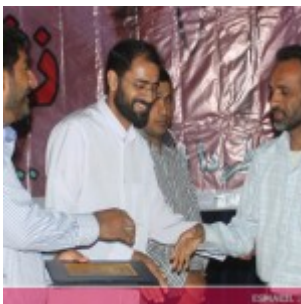
رودان نیوز : همایش فصلی برای زندگی