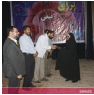
رودان نیوز : همایش فصلی برای نبض زندگی