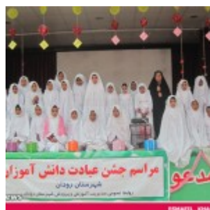
رودان نیوز : 850 دانش آموز دختر رودانی آغاز تکلیف دینی خود را جشن گرفتند