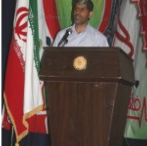
رودان نیوز : همایش فرهنگ سازی سلامت