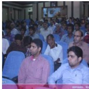
رودان نیوز : همایش فرهنگ سازی سلامت