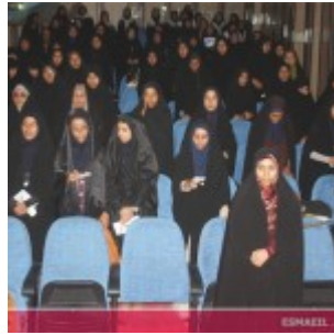
رودان نیوز : همایش فصلی برای نبض زندگی