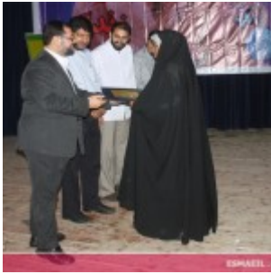
رودان نیوز : همایش فصلی برای نبض زندگی