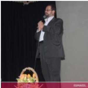
رودان نیوز : همایش فصلی برای نبض زندگی