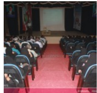
رودان نیوز : همایش فرهنگ سازی سلامت

برنامه های اصلاحی و تربیتی مددجویان درسایه تامین نظم