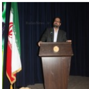
رودان نیوز : همایش فصلی برای نبض زندگی