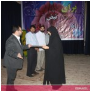
رودان نیوز : همایش فصلی برای نبض زندگی